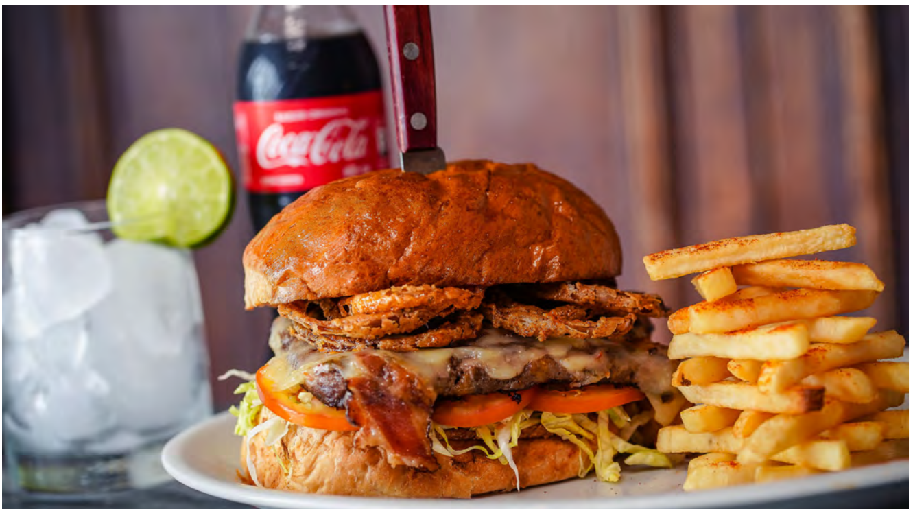
Spicy Gringo California Burger

+ OPCIÓN VEGETARIANA (CON BASE DE FRIJOLES NEGROS) : 41.000