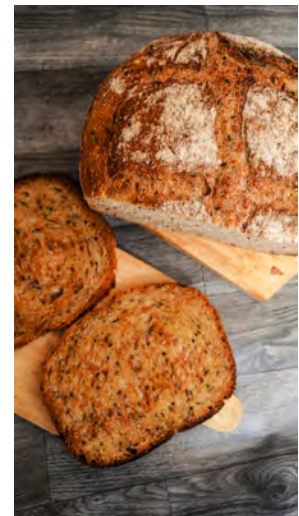
Pan de masa madre